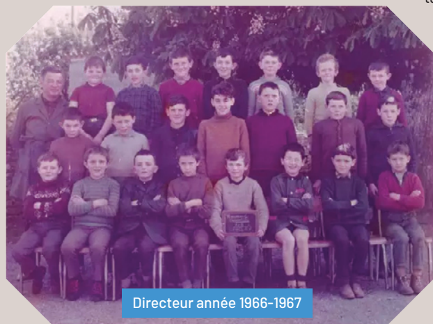
Directeur année 1966-1967