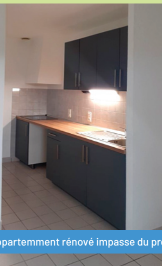
Appartement rénové impasse du presbytere

Les travaux de rénovation de l'appartement Impasse du Presbytère sont achevés. Ce sont ainsi 3 appartements qui auront été entièrement rénovés cette année.